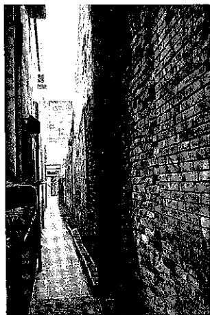
老樹盤桓的牆，古意盎然／長而窄的紅磚道